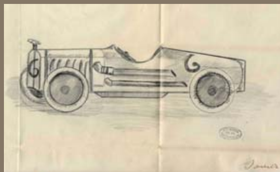
▶ Cotxe de carreres, dibuix de Vilató Voiture de course, dessin de Vilató 1933