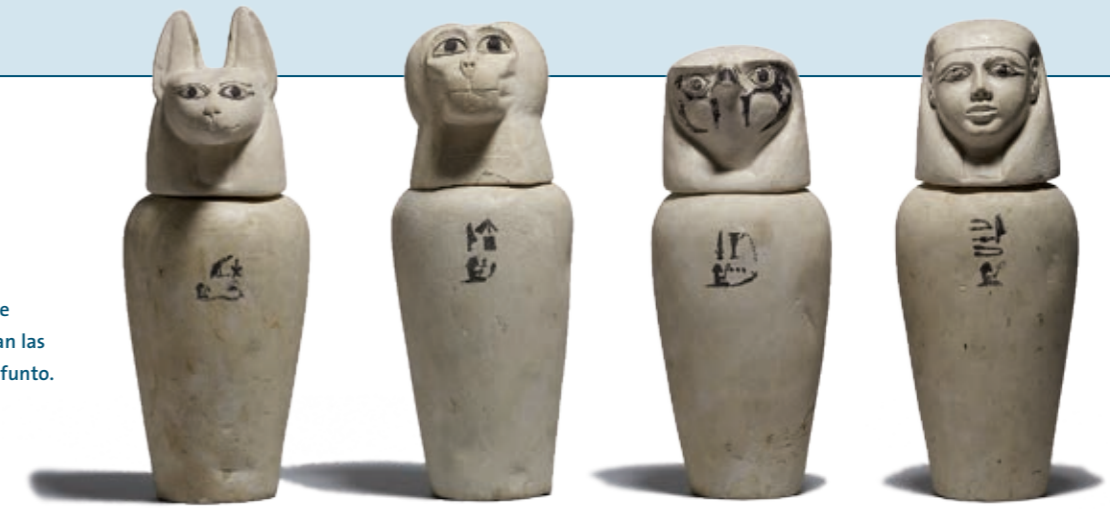
Vasos canopos procedentes de Abidos. En ellos se depositaban las vísceras embalsamadas del difunto.

Dentro de los ritos y creencias funerarias, había castigos para los que no se habían portado bien en vida, como, por ejemplo, que se quemara el cuerpo o que se dejara caer al agua; así se impedía la inmortalidad de la persona y que pudiera ser juzgada por Osiris.