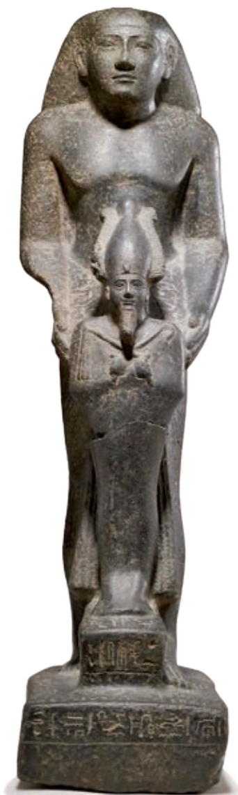
Sacerdote sujetando una imagen de Osiris. Osiris fue embalsamado por su esposa Isis y su hijo Anubis: fue la primera tanatopraxia mitológica.