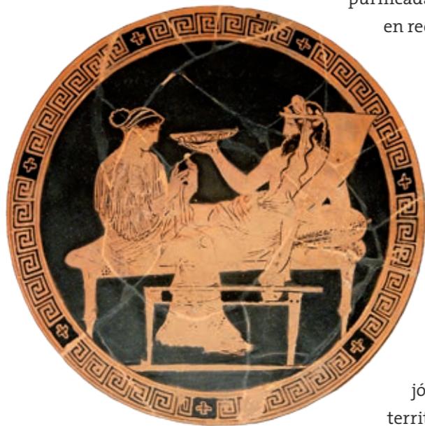
Hades, dios griego del inframundo, vivía junto a Perséfone seis meses al año.

A pesar de que Hades era maligno, tenía un comportamiento altruista y pasivo. Solamente cumplía con la parte que le había tocado manteniendo el equilibrio en el cosmos. Por ese motivo muchas veces se ha confundido a Hades, rey del inframundo, con la figura de la muerte, personificación real de Tánato. Vivía en el inframundo junto a Perséfone y con su corte, a la que no permitía salir nunca de allí. Dos personajes revisten mayor importancia: el can Cerbero y el barquero Caronte.