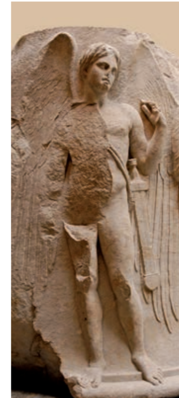
Tánato es la personificación de la muerte no violenta y es hermano de Hipno, el dios del sueño.

El can Cerbero era el perro con tres cabezas que guardaba la entrada del mundo de los muertos y que dejaba pasar a cualquiera, aunque también hay mitos que explican que atacaba a los difuntos y por ello tenían que llevar encima un dulce. Lo que está claro es que no permitía que nadie saliera.