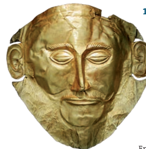
La Máscara de Agamenón, hallada en la acrópolis de Micenas, es una máscara funeraria de oro. Cuando fue encontrada, cubría la cara de un difunto de identidad desconocida.

La sociedad griega daba mucha importancia al hecho de que los hijos enterraran a sus padres según los ritos funerarios. En ellos, las mujeres desempeñaban un papel importante, ya que tenían la responsabilidad de presentar el cuerpo, limpio, perfumado y con ropa blanca. Más tarde, este se vendaba con un sudario que le cubría todo el cuerpo, excepto la cara, y se estiraba sobre el lecho con una corona de flores en la cabeza y los pies hacia la puerta para que los amigos y familiares pudieran verlo por última vez.