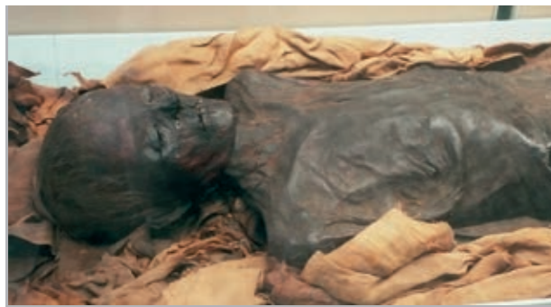
Las altas temperaturas del desierto favorecían la momificación natural en el Antiguo Egipto.

Los cuerpos de los difuntos se enterraban en el desierto bajo la arena aprovechando las altas temperaturas para deshidratar el cuerpo y crear una momificación natural, que frenaba la putrefacción temporalmente. Una vez el cuerpo había llegado al estado deseado, se sepultaba con todos sus bienes. Con el tiempo empezaron a construir edificios funerarios llamados mastabas («banco» en árabe) y con estos a perfeccionar las momificaciones y los ritos funerarios.