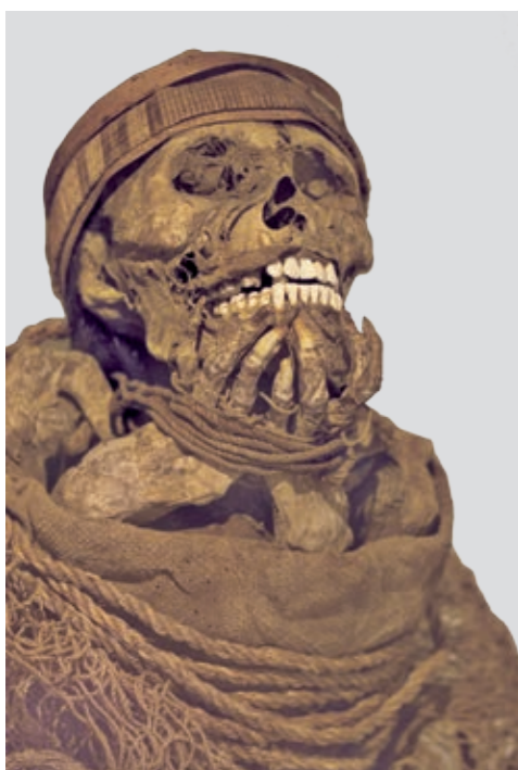
El clima árido de Perú permitía que los cuerpos se deshidrataran sin descomponerse.

A los pocos años de la llegada de los españoles a Perú (1525), el secretario de Pizarro describe la momia de Huayna Capac como intacta, vestida con ropajes suntuosos y a la que solo le faltaba la punta de la nariz. En 1559, el Inca Garcilaso de la Vega describe las momificaciones con mayor detalle: