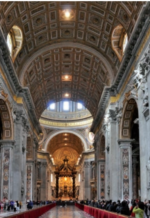
Un sinfín de catacumbas realizadas por los primeros cristianos recorren el subsuelo de la iglesia de San Pedro del Vaticano.

Es la comunidad de mujeres y hombres cristianos que se agrupan territorialmente por diócesis entorno al Papa y que reconocen en él un vínculo de comunicación con Dios. En la actualidad, son cristianos unos 2.300 millones de personas, de los cuales más de 1.000 millones son católicos, casi un 18% de la población mundial.