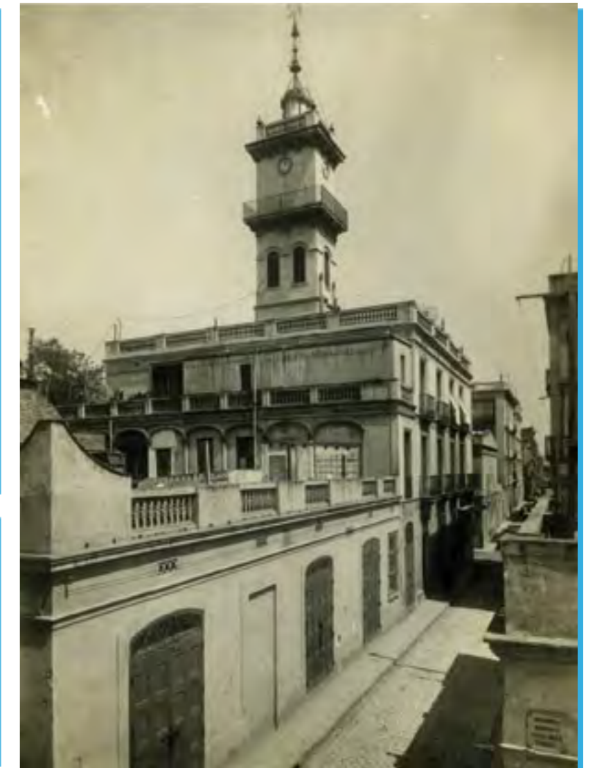
L'edifici de Can Pardal amb el campanar construït el 1878, 1928.