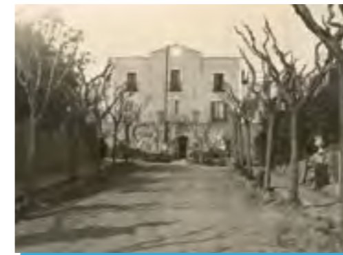
AA El ban promulgant la independència de Gràcia, 1850.