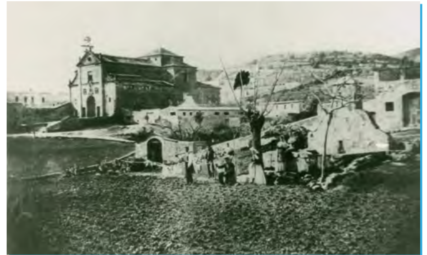
L'església dels Josepets en una de les primeres fotografies que es té constància, dècada de 1860.

La línia divisòria, senyalant com a punt de sortida l'encreuament del Passeig de Gràcia amb Provença, avensaba (Gràcia, sempre a la dreta per l'esmentat carrer, fins a la Riera d'en Bargalló); pujava per aquesta, girava per la Travessera, seguia avan fins a la Riera de Cassoles, continuava per ella, i, al esser al indret de la