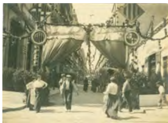
LA VILA DE GRÀCIA, UNA HISTÒRIA RECENT

El territorio de cerca el convento de Nuestra Sra. de Gracia, hallase ya poblado de buen número de masías y casas labriegas. Poco a poco va delimitándose y se perfila el espíritu menestral de la futura Villa.