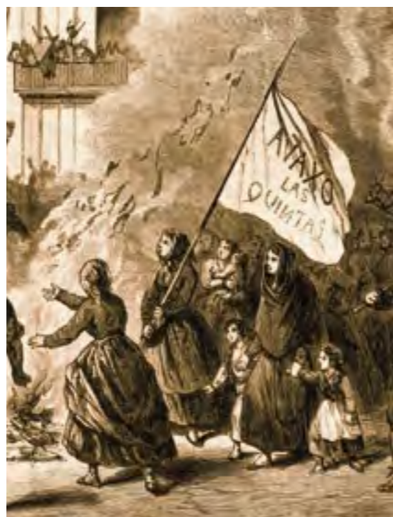
LA REVOLTA DE LES QUINTES